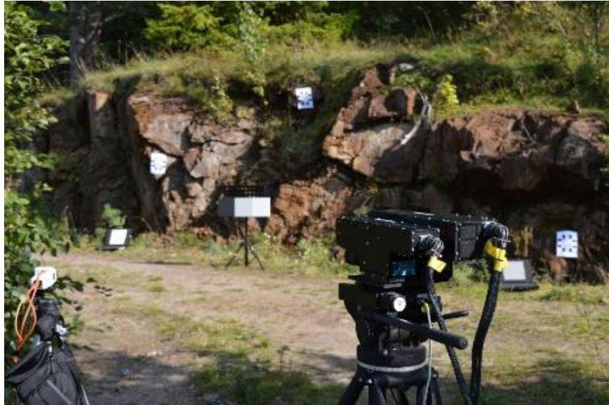
Figura 3: Sistema de espectrómetro de imagen Black HySpex (derecha) y Cubert UHD-185 blanco en una exploración de afloramiento

La transición del mapeo geológico tradicional 2D a 3D (también referido al modelado 3D) es una tendencia moderna en el mapeo geológico. Esta transición, que comenzó hace aproximadamente una década, ha sido una respuesta a la creciente demanda de una comprensión más detallada y mejorada del subsuelo para abordar problemas sociales críticos (agua, captura y almacenamiento de hidrocarburos, ingeniería civil, almacenamiento de desechos radiactivos, etc.). Para cuestiones de recursos minerales, el modelado 3D se ha utilizado para realizar evaluaciones regionales e in situ de recursos minerales (por ejemplo, proyecto de investigación 7PM ProMine de la UE, no 228559), así como para encontrar un enfoque equilibrado para la minería y el uso de la tierra.