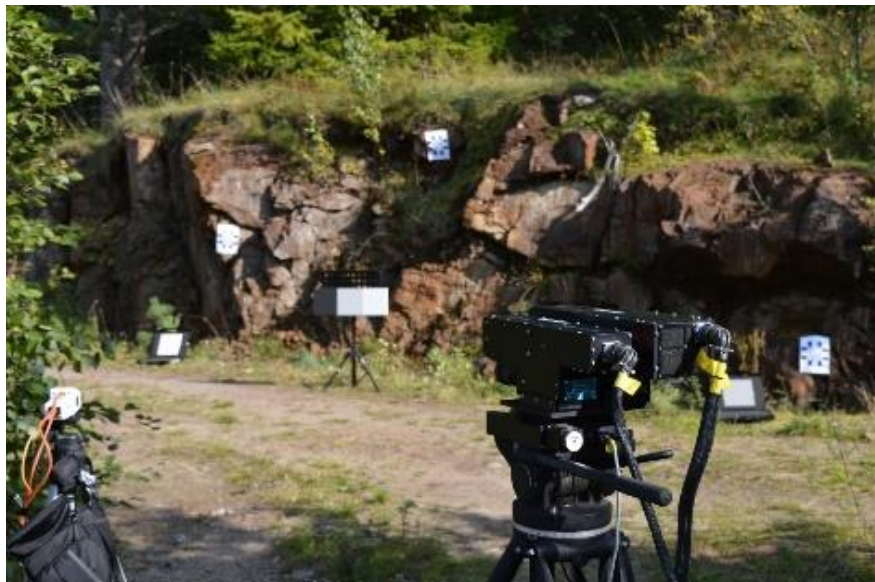
Figura 3: Sistema de espectrómetro de imagen Black HySpex (derecha) y Cubert UHD-185 blanco en una exploración de afloramiento

La transición del mapeo geológico tradicional 2D a 3D (también referido al modelado 3D) es una tendencia moderna en el mapeo geológico. Esta transición, que comenzó hace aproximadamente una década, ha sido una respuesta a la creciente demanda de una comprensión más detallada y mejorada del subsuelo para abordar problemas sociales críticos (agua, captura y almacenamiento de hidrocarburos, ingeniería civil, almacenamiento de desechos radiactivos, etc.). Para cuestiones de recursos minerales, el modelado 3D se ha utilizado para realizar evaluaciones regionales e in situ de recursos minerales (por ejemplo, proyecto de investigación 7PM ProMine de la UE, no 228559), así como para encontrar un enfoque equilibrado para la minería y el uso de la tierra.